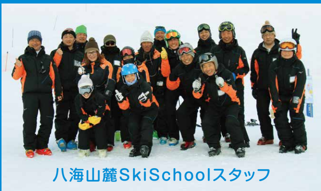
八海山麓SkiSchoolスタッフ

スキーは老若男女問わず、家族や仲間が全員参加で楽しめる生涯スポーツです。スキーを学ぶことは、単なるスキー技術上達だけでなく、基礎体力作り、運動不足解消、ストレス発散、仲間作りなどあらゆることに役立ちます。みなさまが、それぞれの目的でスキーを少しでも楽しんでくだされば、われわれスキー教師としてこれほど嬉しいことはありません。女性一人でのご参加、家族やグループ単位でのご参加、同好会や体育会の合宿も大歓迎です。どうぞ、お気軽にご利用ください。